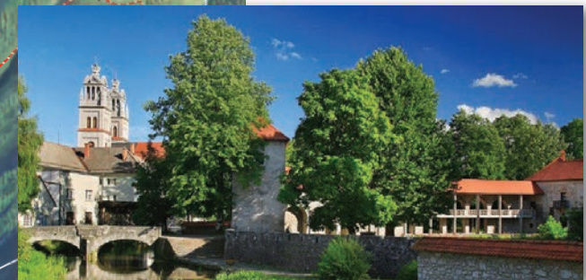
Ribnica, grad, Plečnikovi zvoniki