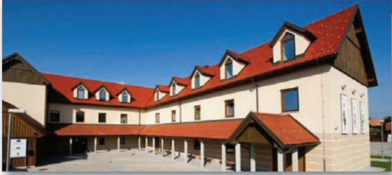
IZHODIŠČE - krajša pot, Rokodelski center Ribnica